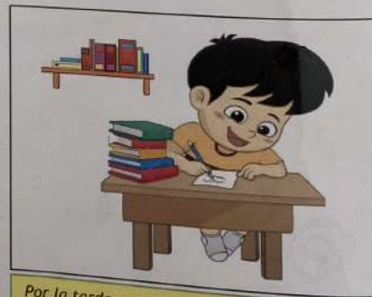
Por la tarde, en casa, hago los deberes de las cinco menos cuarto (16h45) a las seis (18h00).