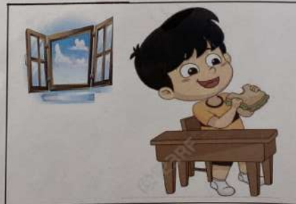
Después, vuelvo a la casa y meriendo a las cuatro de la tarde (16h00).