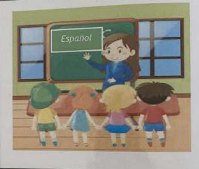
Aprendo español de las dos a la tres de la tarde (14h00 - 15h00).