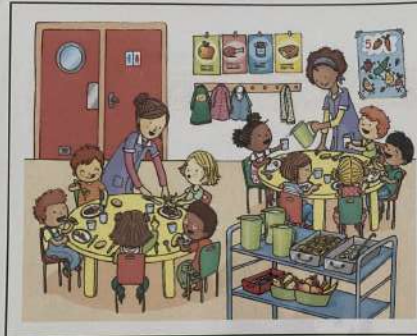
Siempre como en el comedor escolar a las doce en punto (12h00).