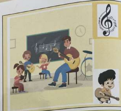
A las diez y cuarto (10h15), tengo una asignatura artística : educación musical.